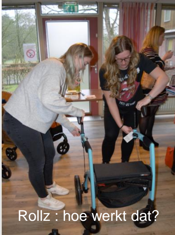
Rollz : hoe werkt dat?