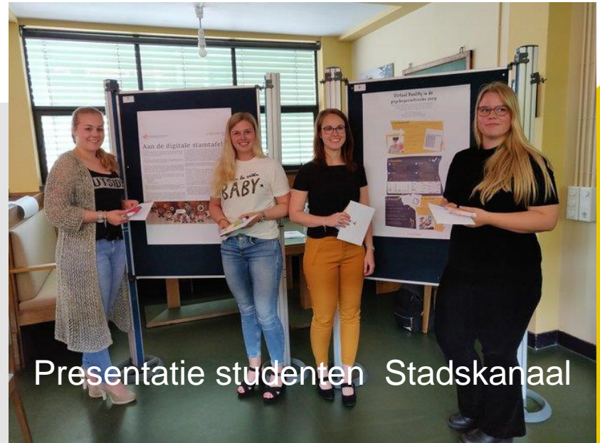
Presentatie studenten Stadskanaal