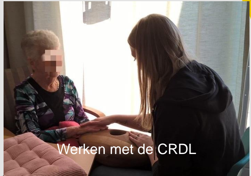
Werken met de CRDL